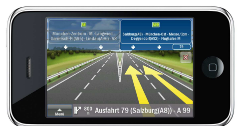
ClearTurn™ für eine realitätsnahe Darstellung von Autobahnausfahrten.

Texte und Bilder zum Download unter www.falk-navigation.de (Rubrik Unternehmen/Presse)